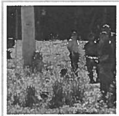
Pide perdón y se suicida por haber matado a Yareida-VÍDEO