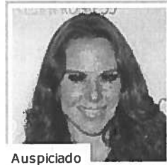
Auspiciado El papá de Kate del Castillo cree que su hija y Luis Miguel "se juntan para llorar sus penas" People en Español