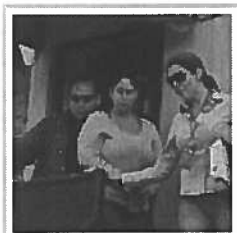
Mujer clama a su pareja que se levante luego de muerto por violencia doméstica - Ve el vídeo