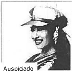
Auspiciado Los mejores momentos de Selena en Premio Lo Nuestro y su homenaje póstumo Premio lo Nuestro