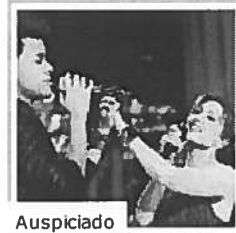
Auspiciado Thalía te canta 'Te Perdiste Mi Amor' junto a Prince Royce. ¡Escúchala! Premio lo Nuestro