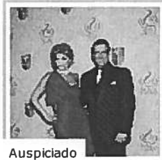
Auspiciado Enamorados en Premio Lo Nuestro