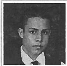
Trágico final para familia de Corozal que salía de pasadía